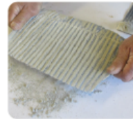
③ウェーブネットの両サイドを引っ張る