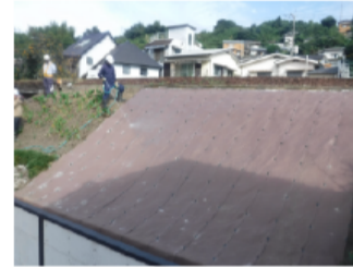
散水状況 (必要に応じて)