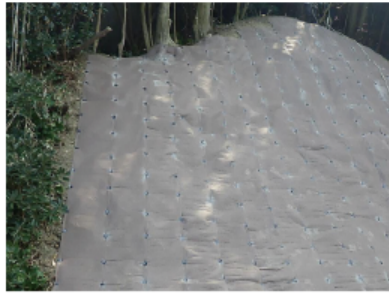
鉄道沿 法面保護工