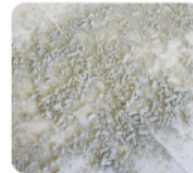
④ウェーブネットからセメントモルタルを分離