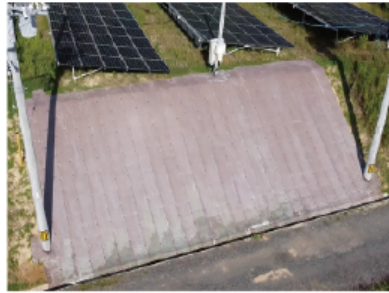
太陽光 法面保護工