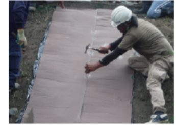
アンカーピン打設状況