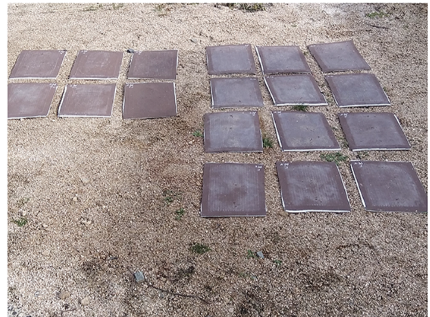
屋外試験(強度測定用)