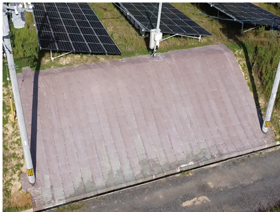
ドライマットを使用した法面保護工