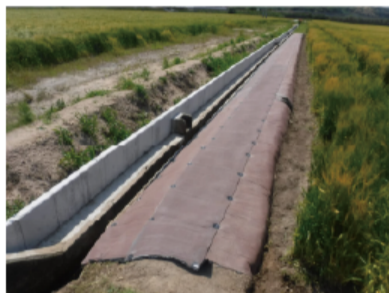
農業 遊歩道と排水路補強