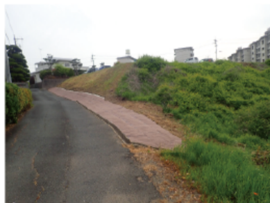
道路沿 法面保護と防草