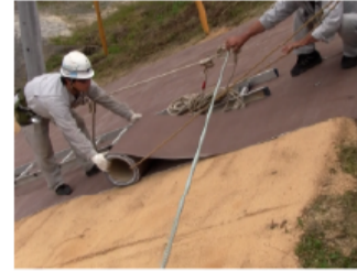
ドライマット設置状況