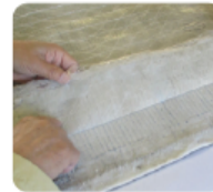
②下層シートをバリバリ剥がす