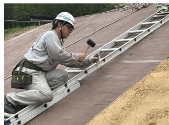
② アンカーピンで固定